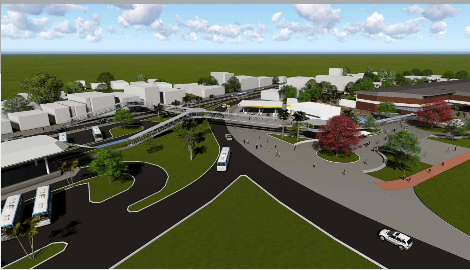
VISTA PASSARELA E PRAÇA DE ACESSO