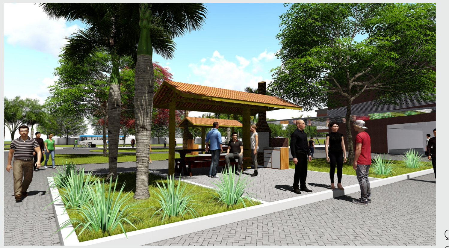
QUIOSQUES PARA LAZER DA COMUNIDADE