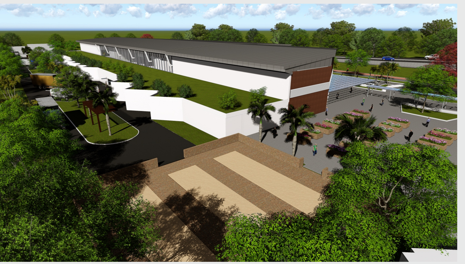
VISTA FLOREIRAS E COMPOSTAGEM