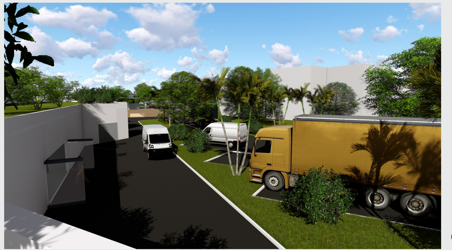
CARGA E DESCARGA