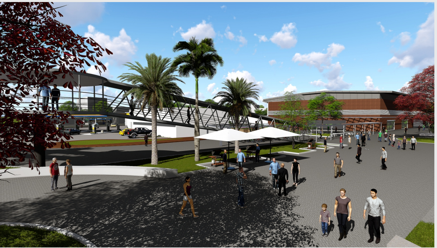
ESPAÇO PARA CARRINHOS DE PICOLÉ, ALGODÃO DOCE..